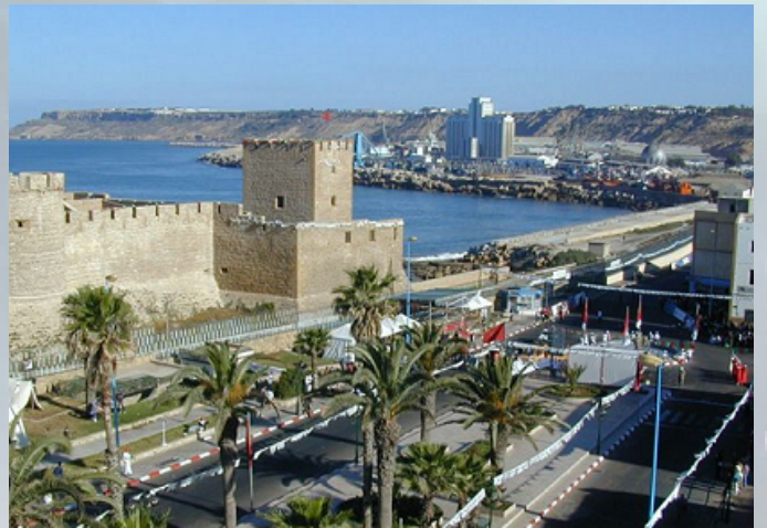
Ville de Safi, Maroc